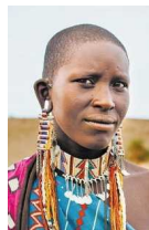
Eine Massai aus einem der Dörfer unterhalb des Gipfels

Dann sah ich ihn. Auf der anderen Seite meiner Augen. Vor mir dieser Berg