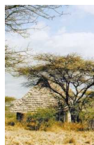
inclusive-Anlage nach Sansibar oder wie ich für sechs Tage zum Kilimandscharo.

Bei wem das Licht auf dem Schnee des Kilimandscharo kein Verlangen auslöst, dachte ich, dem ist auch nicht mehr zu helfen. Nun konnte ich auch sehen, wie gut der Maler mit seinem, meinem Bild den Berg getroffen hatte. Es war ein Wiedersehen mit der eigenen Sehnsucht. Neben mir auf der Terrasse der Lodge stranden zwei sympathische Frauen, Südtirolerinnen vom Kalterer See. Und der Berg wurde durch unser Hin- und Hinaufschauen nicht kleiner. Ich zeigte ihnen, als wäre es nicht genug