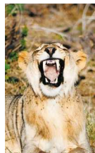
Eine brüllende Löwin in der Nähe des Camps Kambi ya Tembo (u.)