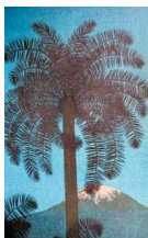
»Der Kibo mit Palme«, gemalt vom Stuttgarter Künstler Fritz Lang 1931

Sehnsucht dahin. Und ein Berg wie der Kilimandscharo verdankt seinen Sehnsuchtsrang gewiss auch dem Namen. Was, wenn er Erzkrasten hieß oder Knüll oder immer noch Kaiser-Wilhelm-Spitze, wie einst einmal, als er zu preußisch-kolonialen Zeiten als höchster Berg des Deutschen Reiches galt? Im Museum von Arusha im Norden Tansanias, in dem Gebäude, das einst der Hauptsitz der deutschen Kolonialherren war, las ich nach meiner Ankunft auf einem Plakat: »Kolonien fördern die Vollkornernährung. Es stammt aus einer Zeit, als der Mensch noch Kolonialwaren bei Tante Emma bekam. Im Stil eines Belle-Époque-Plakats von Bacardi war ein Schwarzer zu sehen, der unter Palmen Ware zu einem arabischen Auslegerboot schleppte, während im Hinter-